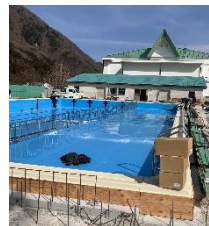
順調に進んでいます！

まずは、「願いをもつ」ことから。これからも学校では、「あなたはどうかしたいの。」と願いを問い、「思い通りにできなくても大丈夫。」と前向きな挑戦を支え、「どうするか、どうしようか一緒に考えよう。」と共に試行錯誤すること、そして、子どもたちが「自ら考える」ことを大切にしていきます。来年度も、どうかよろしく願いいたします。