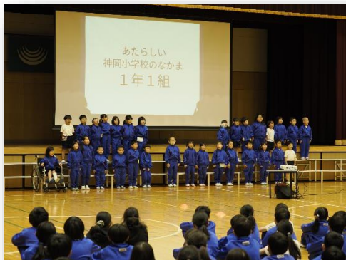
素敵な1年生を迎える会

これからの学校生活の中で、私たちが気づかないこともたくさんあると思います。そのときは、ぜひ遠慮なく教えていただけるとありがたいです。今年度もどうぞよろしくお願いいたします。