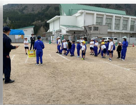
自分の命を守る交通安全