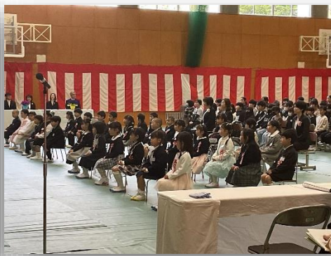
新1年生入学おめでとう